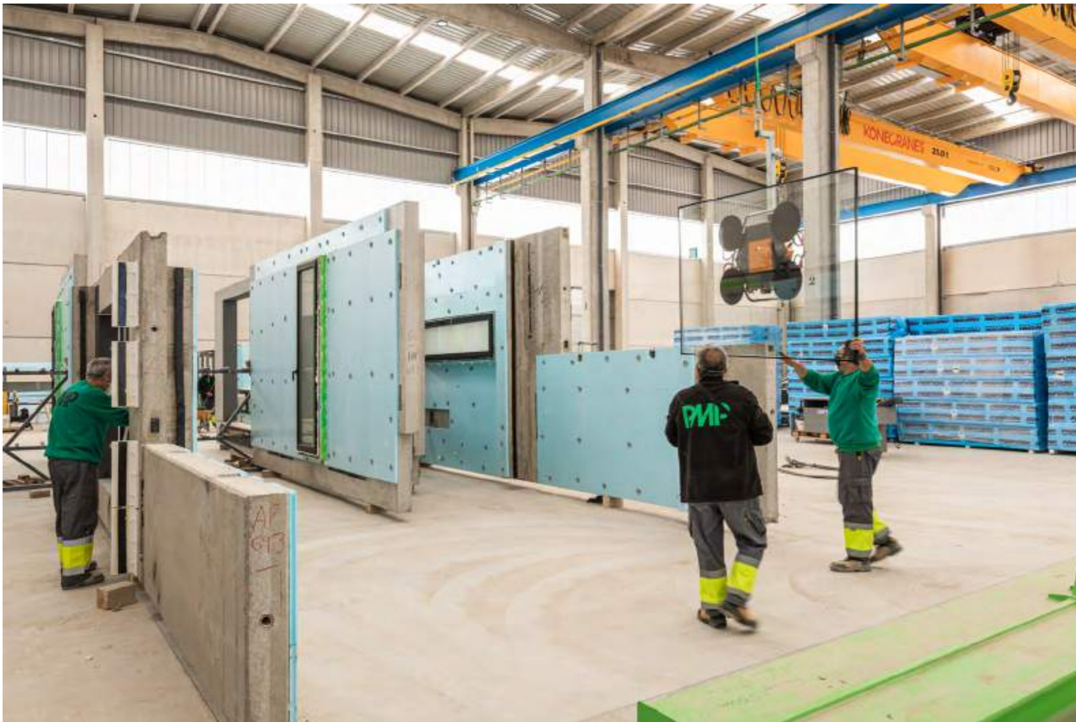
Fábrica y centro logístico propio.